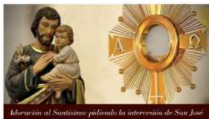
Adoración al Santísimo pidiendo la intercesión de San José

Miércoles al terminar la misa de las 20h