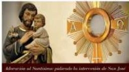
Adoración al Santísimo pidiendo la intercesión de San José

X 27: - Ensayo Primeras Comuniones (17.30h) - Catequesis 1º Comunión (18 h.) - Adoración , a las 20.30 h.